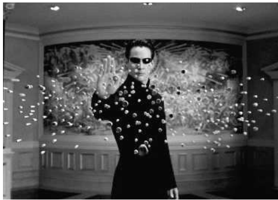
Neo (Keanu Reeves) dans Matrix

où le vrai et le faux s'entremêlent d'où la difficulté pour lui d'accepter le changement et ce que cela implique. The Game de David Fincher : « Un homme d'affaires reçoit pour son anniversaire un étrange cadeau de