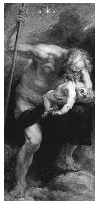
Peter Paul Rubens (1636) Cronos dévorant Poséidon

Pour survivre un ogre a besoin de sa ration de chair fraîche et de sang. Alors le roi faisait des enfants juste pour les manger, s'assurant ainsi de n'être jamais détrôné. Un seul de ses fils parvint pourtant à s'échapper. Pendant très longtemps il resta caché tant il avait peur d'être dévoré par son père. Mais un jour le fils décida enfin de vivre et de se venger. Alors le fils éventra le père, libérant ainsi tous ses frères qui le sacrèrent roi pour le remercier de son courage. Et la seconde génération remplaça la première, en place depuis trop longtemps.