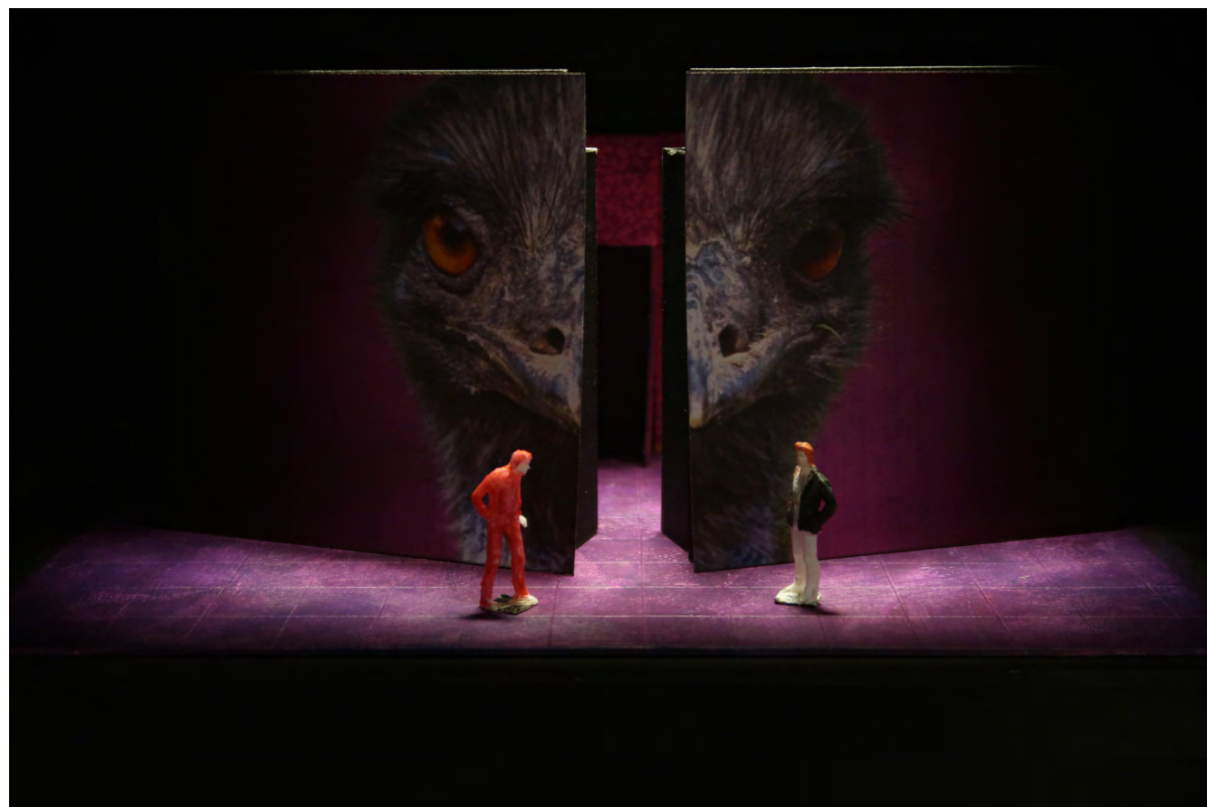
Photos de la maquette scénographie, septembre 2024