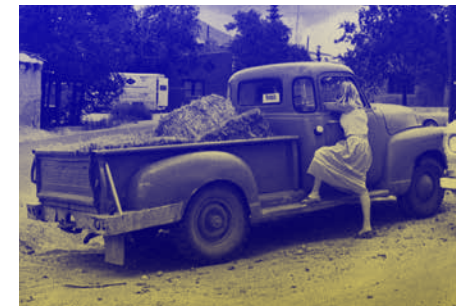
La Pomme dans le noir