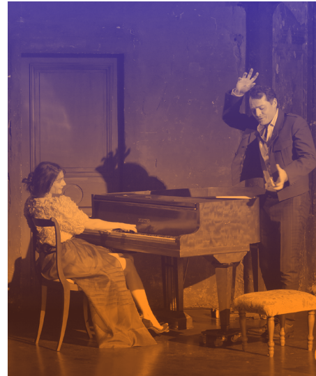
Traviata – Vous méritez un avenir meilleur