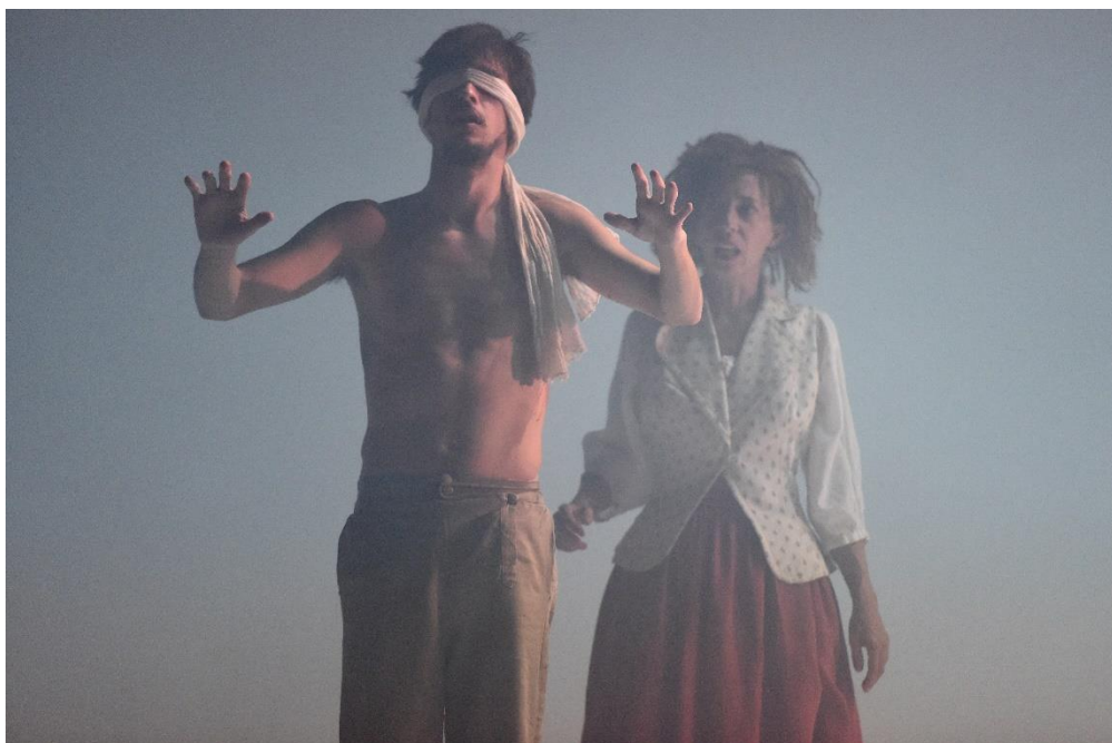
Candide texte Voltaire mise en scène Arnaud Meunier