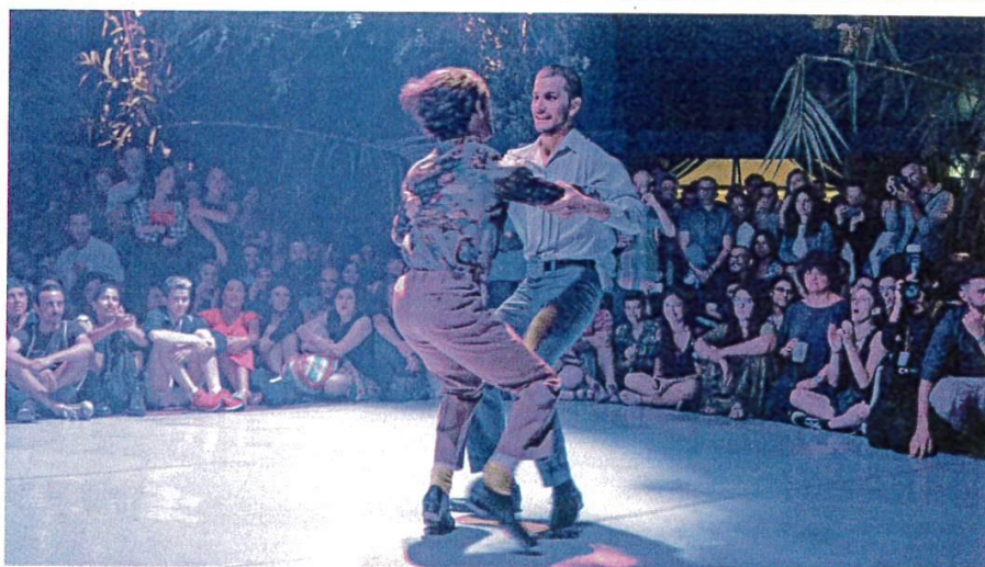
Dans Save the last dance for me , le chorégraphe Alessandro Sciarroni cherche à faire revivre la polka chinata. Très physique, cette danse de séduction est interprétée par des hommes uniquement.

► Transe-en-dances : du 16 au 26 mars, événement de la MC2, avec le CDCN-Le Pacifique, le CCN2, le TMG, le festival Détours de Babel, la Cinémathèque de Grenoble et le Musée dauphinois, à Grenoble. ► Journée des danses urbaines : samedi 19 mars, à la MC2, à Grenoble. Programme détaillé sur mc2grenoble.fr / 04 76 00 79 00. billetterie@mc2grenoble.fr