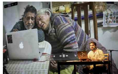
Reminiscencia Malicho Vaca Valenzuela, 2024

Reminiscencia Jusqu'au 21 juillet à 11h et 18h Gymnase du lycée Mistral