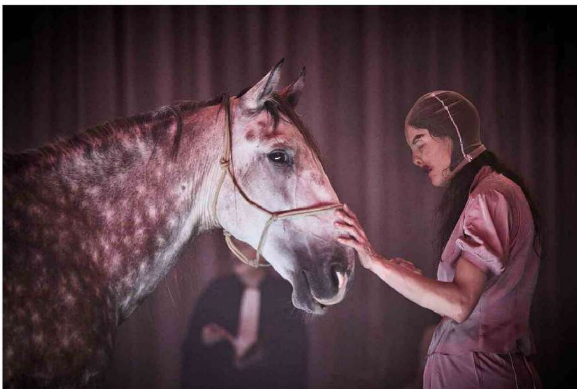
« Léviathan » de Lorraine de Sagazan.